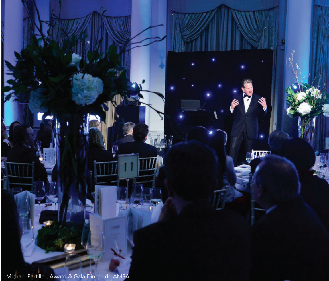
Michael Portillo , Award & Gala Dinner de AMBA

que alcanzaron los mejores logros en el año: Premio de The Independent al mejor estudiante MBA del año, el MBA Innovation Award y el Premio MBA Entrepreneurial Venture.